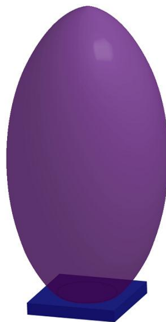
タグ読取エリアのイメージ