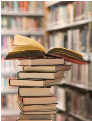
図書の自動貸出機