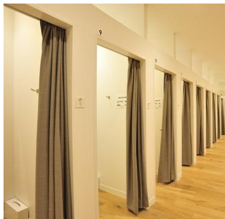
試着管理によるマーケティング